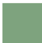
SALVIA RAL 6021