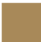
SENAPE RAL 1024